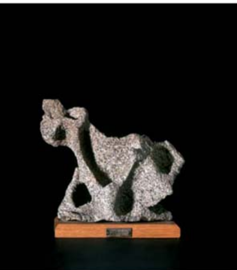
Os petrificat [Poema de pedra número 6] 25 × 27 × 12 cm Fundació J. V. Foix

El mateix Poema número 6 amb una altra il·luminació.