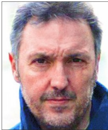
Don Winslow (izq.) es uno de los grandes autores internacionales que acuden este año a un BCNegra que supone el estreno del escritor Carlos Zanón (der.) como comisario del certamen literario