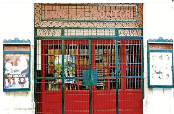
L'entrada a l'entranyable cinema torroellenc.

La sala va viure els anys de més esplendor al tombant de la dècada de 1990 a 2000. Coincidint amb l'any de l'estrena de Titanic , es van superar els 29.000 espectadors anuals. La sala treballa bé quan assoleix la mitjana de 24.000 espectadors, cosa habitual durant molts anys, però la recent caiguda d'assistència, que els empresaris de cinema han relacionat amb la pirateria, l'esclat d'Internet i la pujada de l'IVA del Govern espanyol, permet aventurar que difícilment se superaran els 15.000 espectadors