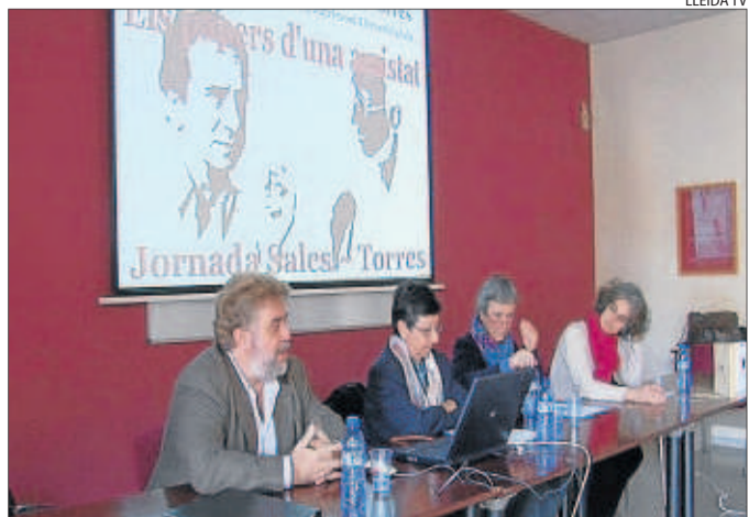
La UdL va acollir ahir una jornada en record a Torres i Sales.