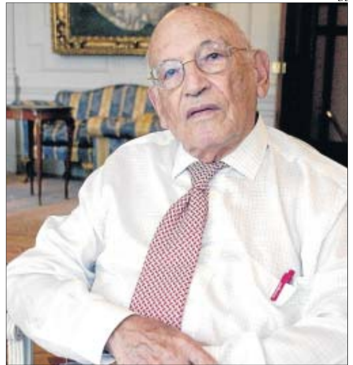
Imatge d'arxiu del 2004 de Francisco Rodríguez Adrados.