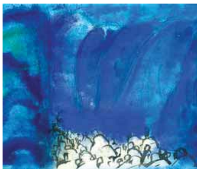
Mar Roig una de les il·lustracions P.PASTOR

El Museu Morera exposa fins al 5 de gener unes 350 il·lustracions de les 1.500 que l'artista de la Seu d'Urgell va crear per il·lustrar els diferents llibres que conformen la Bíblia. La mostra, organitzada pel museu i l'obra social de Catalunya Caixa, fins