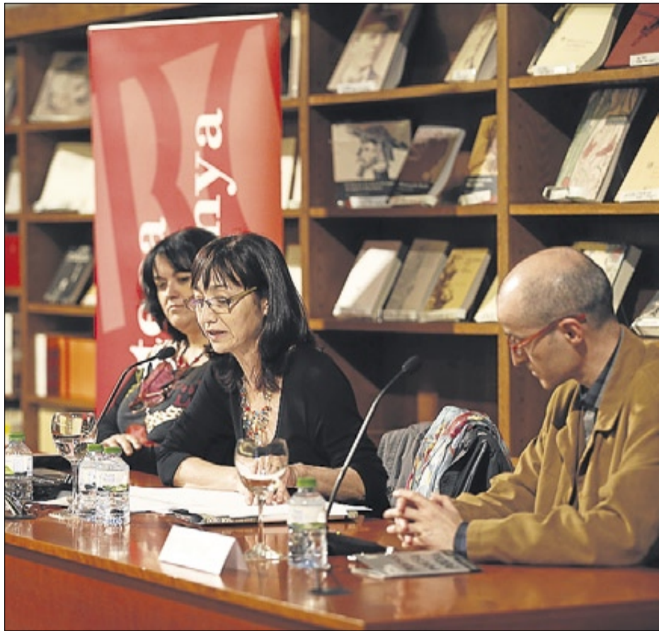
► Sessió d'audició de poetes (com J. V. Foix i Josep Carner, a la foto), ahir, a la Biblioteca de Catalunya.

FONOTECA A LA WEB // El miracle és possible gràcies a la Fonoteca de la Cèdrea Màrius Torres de la Universitat de Lleida, que ofereix lliurement a la web ( www.catedramariustorres.udl.cat ) les gravacions de poetes cata-